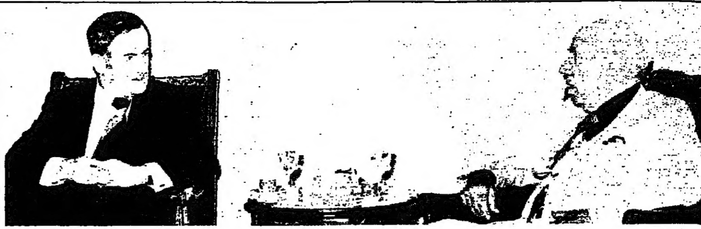
الرئيس الأسد لدى استقباله سعيد قريحه

هيكلكم هذه خطة كارتر للسلام يقول الأستاذ محمد حسين هيكل في مقاله اليوم: هل نحن - أخيراً - وبعد طول انتظار - أمام رئيس أمريكي يرفض الانسحاب المطلق لإسرائيل، ويصمم على موقف مستقل خاص به، ويدافع عن نفسه وعن موقفه مهما كلفه الأمر، مما يجعله في النهاية - أراد أو لم يريد - معنا في نفس الخط ضد إسرائيل؟ ومن خطة الرئيس الأمريكي كارتر للسلام في الشرق الأوسط - قال هيكل: في مقال تلك تسحب إسرائيل إلى خطوط بين الاتفاق عليها وتكون قريبة، على نحو أو آخر، من خطوطها قبل سنة ١٩٦٧، وذلك فيما يتعلق بالجبهة المصرية والجبهة السورية، وترتبط عملية الانسحاب ومرحلة عملية تقسيم السلام لإسرائيل وطرفاته. بالنسبة للفلسطينيين فإن كارتر على استعداد أن يستعمل نفوذه ليكون الوطن الفلسطيني المقترح في جزء من الضفة الغربية للاردين، لكن ذلك شروطاً لا بد منها - بالنسبة لضم الضفة الغربية إلى إسرائيل، فإن خطة كارتر لا تتوقع نشوء عقبات جدية في هذا المجال - يأمل الحديث من اقتنى إلى مرحلة لاحقة. وقال محمد حسين هيكل: والغريب أن إسرائيل تتخطف آراء هذه الخطة، أو بتعبير أدق قلها تقبل ويمسحها وترفض بعضها الآخر. (المقال على الصفحة ٧)